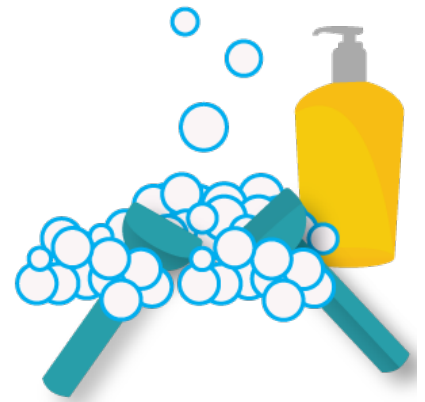
3. Frótate las manos una contra otra para producir espuma.