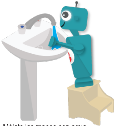
1. Mójate las manos con agua tibia en el lavamanos.

Lavarse las manos sirve para mucho más que retirar la suciedad. Evita que te enfermes y es una medida de seguridad muy importante en la cocina. Cool-E te recomienda estos pasos para lavarte bien las manos.